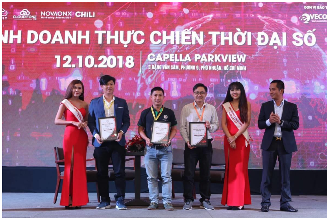
12. Getfly đồng hành cùng doanh nghiệp tiếp cận chuyển đổi số và hội nhập tại Hội thảo kinh tế 2019.