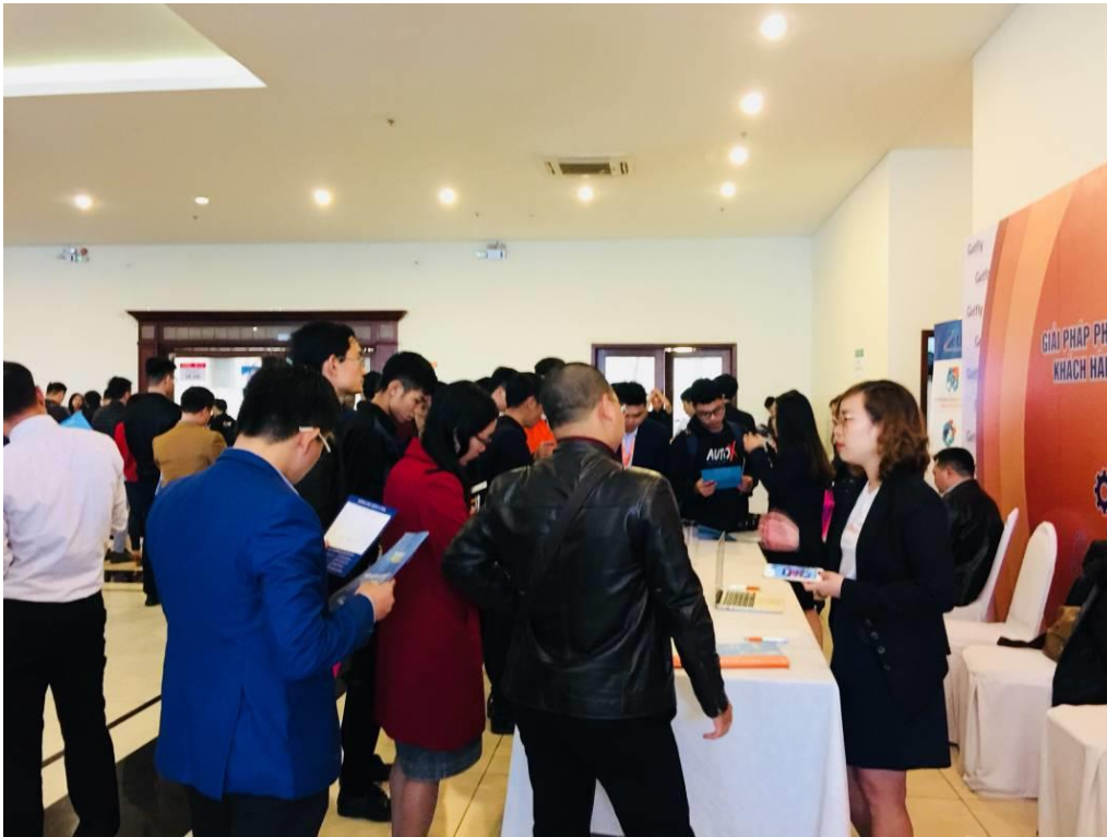
11. Getfly đồng hành cùng sự kiện Kinh Doanh Thực Chiến Thời Đại Số ngày 12/10/2018