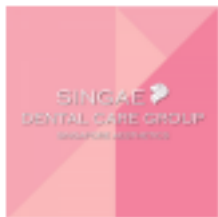
PHÒNG KHÁM NHA KHOA